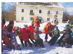
вы: дуэт «Лель да Лада», фольклорный ансамбль «Веретенца» и хор русской песни Дома культуры «Андреевка» «Калинушка».

25 и 26 февраля в Алабушево и Андреевке прошли Масленичные гулянья. Гостей праздника встречали гигантские ростовые куклы и скоморохи.