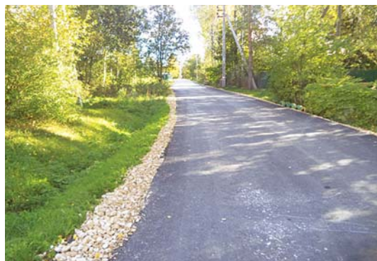
За счет средств местного бюджета отремонтировано 7 дорог общего пользования протяженностью 3,178 км

Общий размер субсидий из дорожного фонда Московской области составил 1029 тыс. руб. За счет средств местного бюджета отремонтировано 7 дорог общего пользования протяженностью 3,178 км.