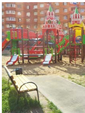
Установлено 5 детских игровых площадок с современным игровым и спортивным оборудованием, пешеходными дорожками и местами отдыха

эксплуатации проводилась в ходе совещаний, контрольных проверок на местах и непосредственного участия сотрудников в разработке необходимой документации.