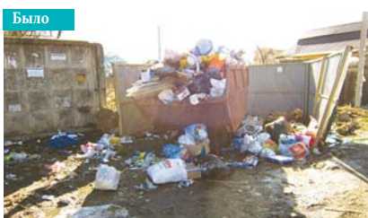
с. Алабушево, ул. Центральная