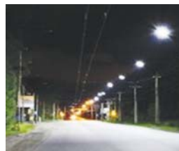
Заменено 448 светильников на энергосберегающие; установлено 87 новых опор и новых светильников; проложено 2,9 км новых линий освещения (СИП)

Выполнены работы по устройству наружного освещения дороги от ул. Западная в с. Алабушево до мкрп Дедешино в рамках муниципальной программы «Развитие жилищно-коммунального хозяйства городского поселения Андреевка на 2016-2018 гг.».