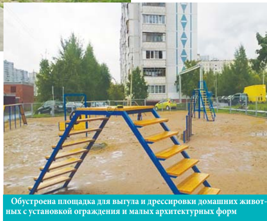
Обустроена площадка для выгула и дрессировки домашних животных с установкой ограждения и малых архитектурных форм

В 2016 г. администрацией проведены работы по освобождению