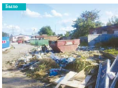
с. Алабушево, Вокзальная площадь

Вот фотофакты: так выглядели мусорные контейнеры до создания предприятия. А эти снимки сделаны после того, как сотрудники МБУ «Жилищник» приступили к исполнению обязанностей. Разница очевидна, и вряд ли кто-то захочет вернуться к прошлому.